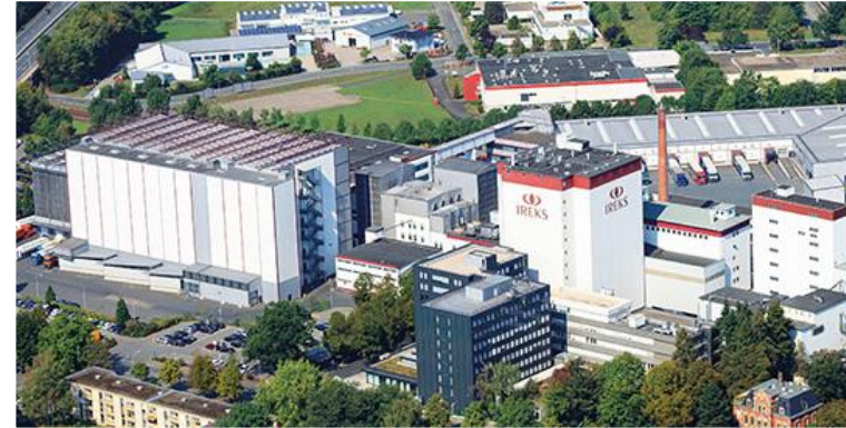
IREKS plant in Kulmbach Germany